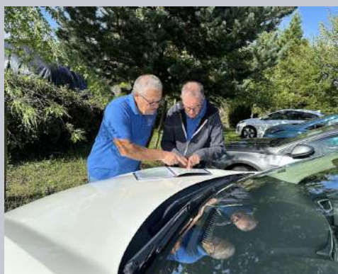
Toujours en recherche de nouveaux parcours